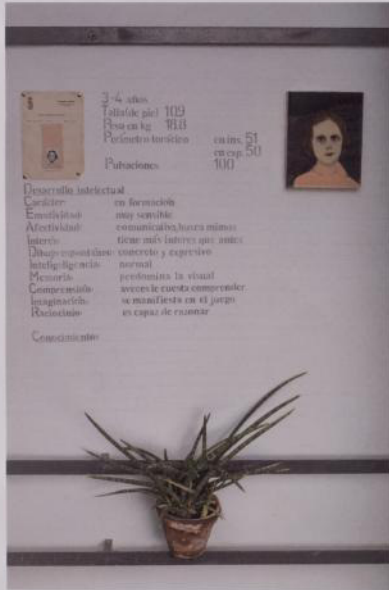
Im 1 Detall vista interior local moda Circo Familiar, La Plaça, Barcelona 2016. Pintura al·tèrcia sobre tauler de fibra, text gravat sobre most document d'avisu general i text amb Cactus d'avisu familiar