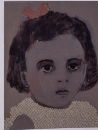
Im 2 i Im 3 Olla i ventra sobre tauler de fibra 18 x 24 cm pertanyents a la sèrie Circo Familiar actualment a la col·lecció de la galeria 2016