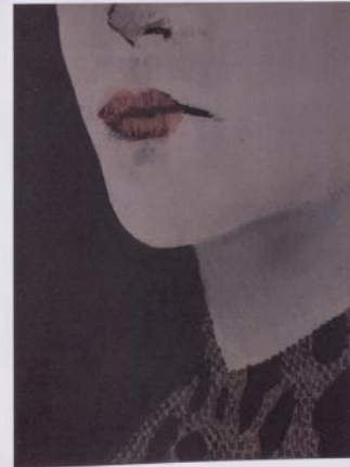
Im 4 gender Camisa Cartón pulido paper 15,5 x 95 cm 2016